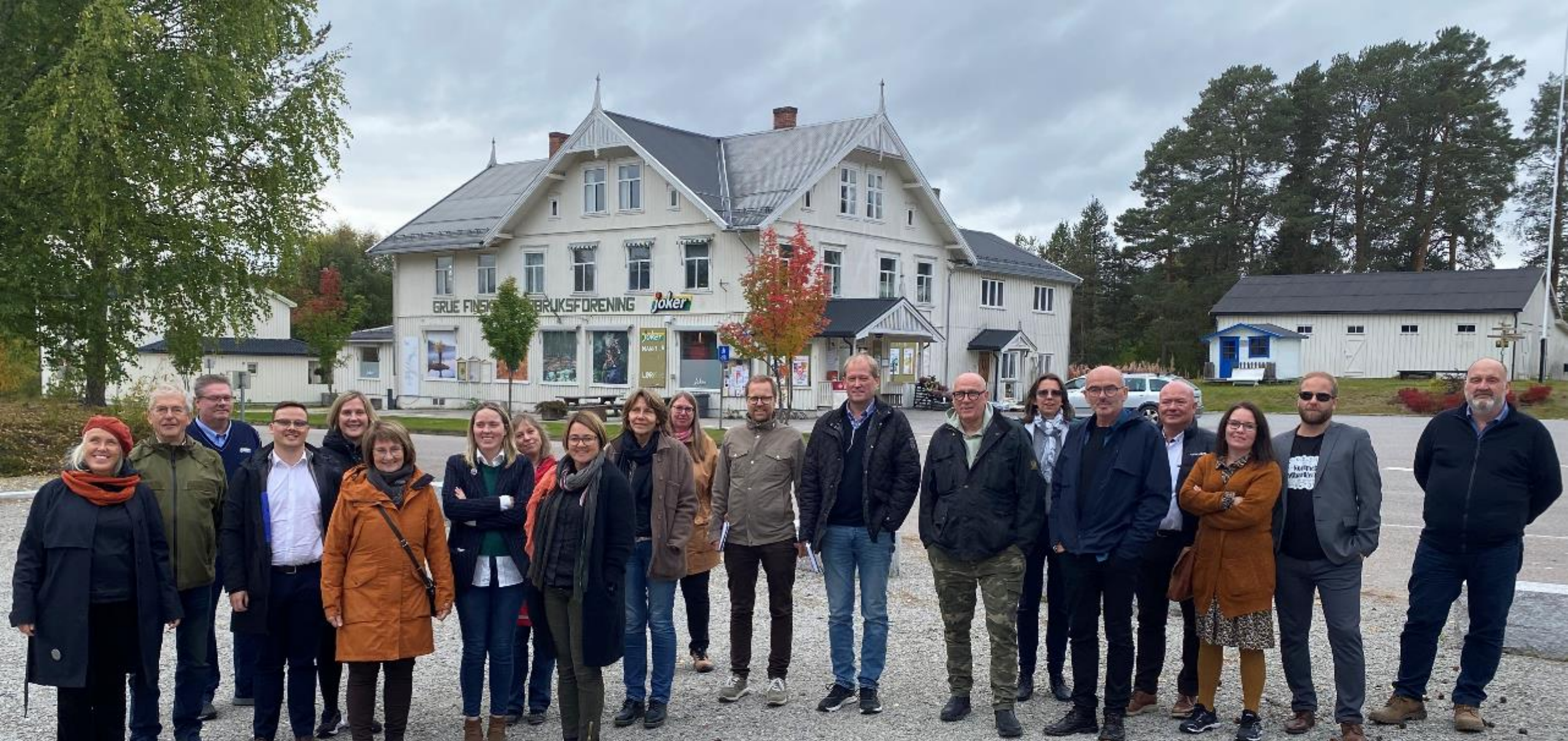
Oppstartssamling Svullrya, Finnskogen – 22.-23.9.22